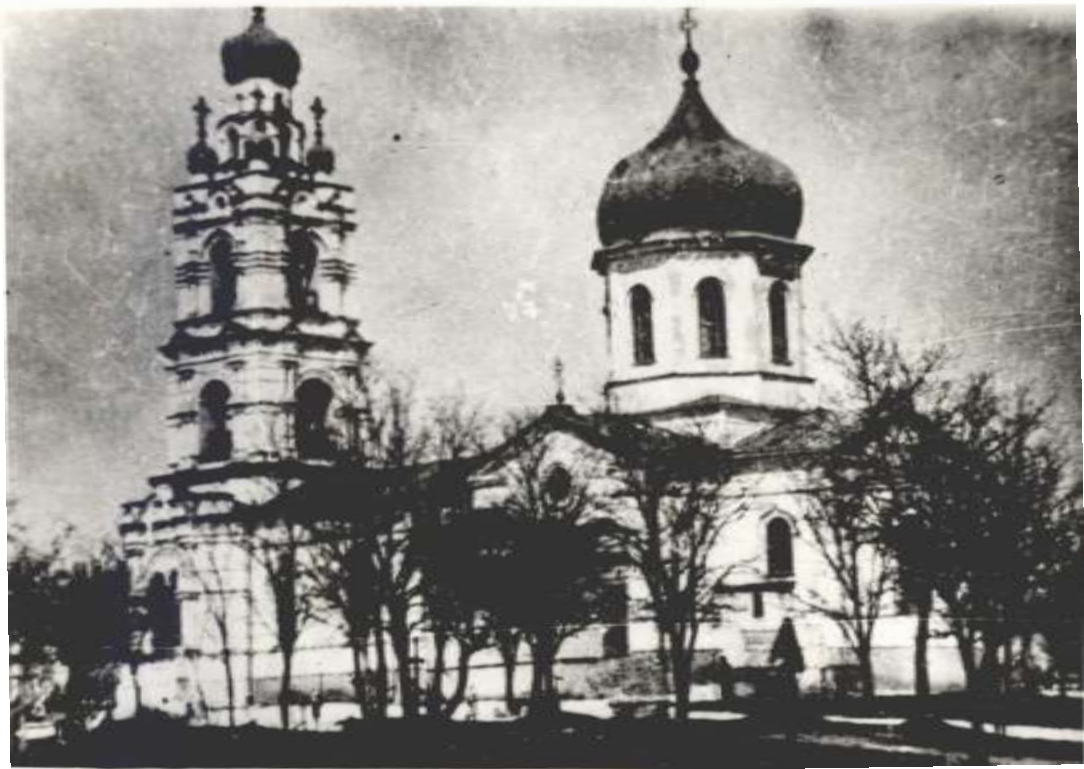
Пантелеймоновская церковь города Ейска