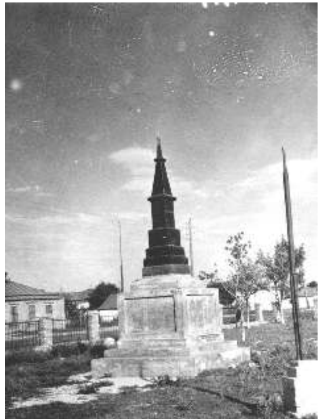
Памятник на могиле погибших жителей г. Ейска в годы Гражданской войны на площади Революции, 1953 г.