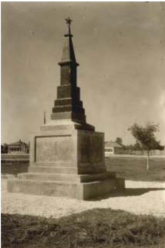
Памятник на могиле погибших жителей г. Ейска в годы Гражданской войны на площади Революции, 1948 г.