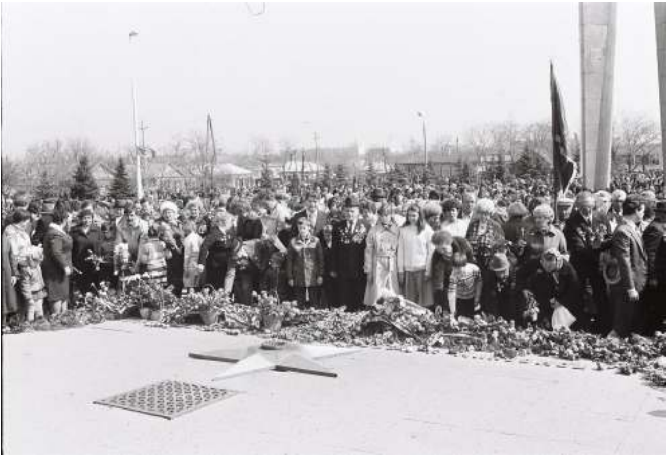
Митинг-реквием Площадь Революции, 1986 г.