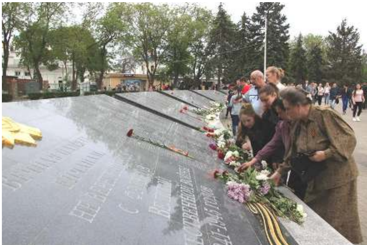
Возложение цветов на церемонии открытия мемориальных плит 8 мая 2018 г.