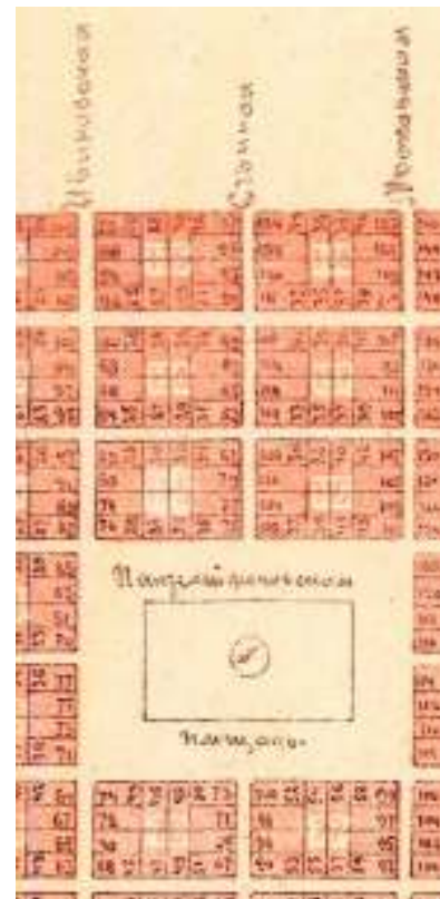
Фрагмент плана г. Ейска начала 20-х годов XX века