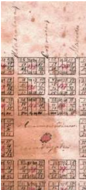
Фрагмент плана г. Ейска 1898 г.