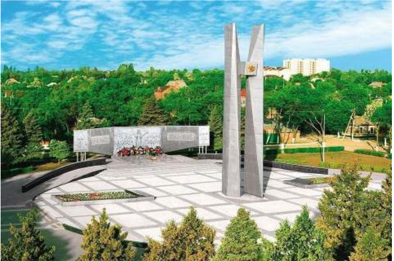
Вид сверху на мемориальный комплекс на площади Революции, 2016 г.